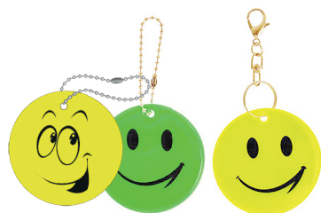
Брелоки и подвески